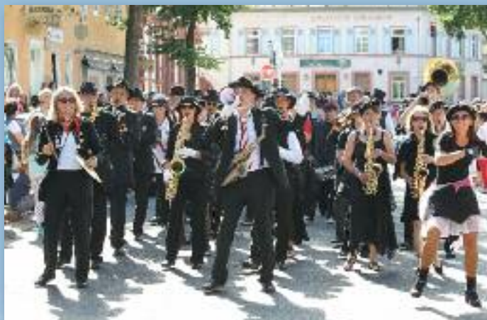
SummerJazzParade in Groß-Umstadt.

(sgu) Die beliebte SummerJazzParade in Gross-Umstadt bietet auch im Jahr 2019 wieder ein überaus buntes Programm mit einer Menge internationaler Live-Musik! Mit von der Partie: Dixie-, Swing-, Latin-, Soul-, Rock'n' Roll und Blues-Bands, Cheerleader-, Showtanz-, Sambaformationen und Oldtimer.