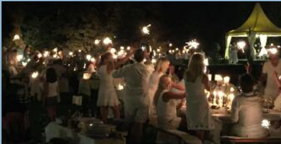
Weißen Dinner in der Schlossstadt Heusenstamm.

Wer das Heusenstammer Sommerkino im Schwimmbad erleben möchte, kann sich am Freitag, dem 16.08. und Samstag, dem 17.08.2019 im Schwimmbad die Filme Bohemien Rhapsody (Freitag) und den Disney-Film Aladin (Samstag) im Freilicht-Kino ansehen. Der Eintritt beträgt € 6,00, die Filme starten bei Eintritt der Dunkelheit.