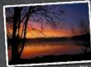
Sascha Kipper, Gewinner des 3. Rodgauer Fotowettbewerb

4. Rodgauer Fotowettbewerb Fotos einsenden bis 18.08.2019