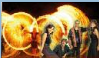
Freilichtbühne Bad König »In Flammen«.

im Amphitheater! Unter Mitwirkung der beeindruckenden Band Dhalia's Lane und der Künstler von artARTISTICA wird das gesamte Amphitheater in magisches Licht tauchen, eine verzauberte Welt aus Klang und Licht wird das Publikum begeistern.